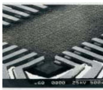
TAB – Tape Automated Bonding (b)