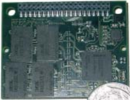
Die Geldmünze erlaubt eine realistische Grösseneinschätzung

die kleinstmöglichen Standardgehäuse und CSPs verwendet.