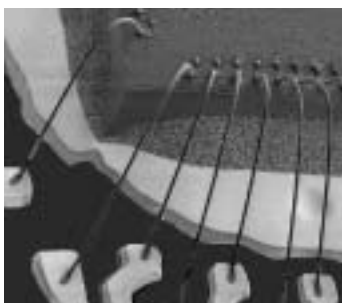
Drahtbonden – Wire bond (a)

Die von Art of Technology im Auftrag von Pendragon Medical für den PENDRA entwickelte Elektronik wurde in einer Mischtechnologie aufgebaut. Grosse Komponenten wie Prozessor und Displaytreiber wurden als Chip on Board (COB – Bare Dies mit Wire Bonding auf PCB) aufgebaut, alle anderen Komponenten sind in SMT montiert. Es wurden aber auch hier