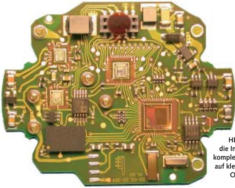
HDP ermöglicht die Integration von komplexer Elektronik auf kleinstem Raum. Originalgrösse: 47 × 34 mm

eine USB-Schnittstelle, GPIO-Pins sowie einen Memory-Slot für externe Speicherkarten (miniSD-Card).