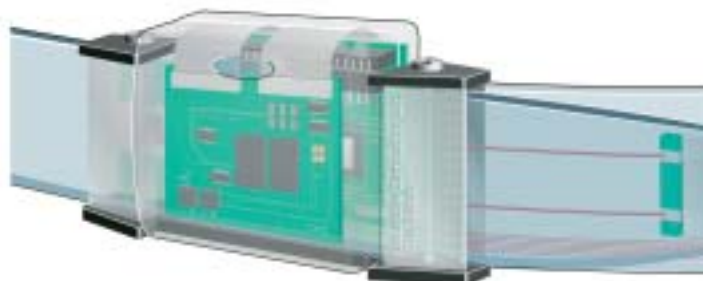
Der QBIC – der Computer in der Gürtelschnalle – ist rund 30 Prozent kleiner als vergleichbare konventionelle Lösungen

Das System beinhaltet einen XScale- (Intel PXA 263 B 1 C 400-) Prozessor mit 32 MByte internem Flash Memory, 256 MByte SDRAM, einen VGA-Anschluss, einen Low-Power-RF-Transceiver, einen RS 232-Serial-Port, ein Bluetooth-Modul,