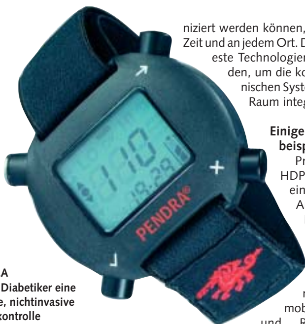
Der PENDRA bietet dem Diabetiker eine permanente, nichtinvasive Blutzuckerkontrolle

In der Mikroelektronik tätige Unternehmen führen einen Wettlauf mit der Zeit, im Bestreben ständig kleinere, leichtere, mit mehr Funktionen versehene und dabei noch kostengünstigere Produkte auf den Markt bringen zu müssen. High Density Packaging (HDP) hat sich als eine Alternative zum teuren und langwierigen ASIC-Design in den letzten Jahren – fast heimlich – einen Namen gemacht. Insbesondere für in Europa typischerweise kleine und mittlere Stückzahlen ist es eine hoch interessante Miniaturisierungsmöglichkeit, da es eben auch sehr kostengünstige, schnelle sowie flexiblere Designs erlaubt.