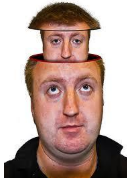
Zwei Köpfe sind besser als einer

Für weitere Informationen über Art of Technology, unsere Dienstleistungen und einige Kundenprojekte, die wir bereits durchgeführt haben, besuchen Sie unsere Webseite www.aotag.ch